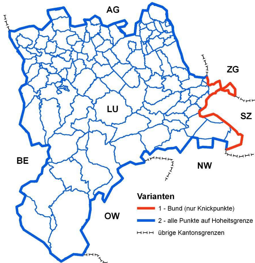
Abbildung 1: „Varianten“