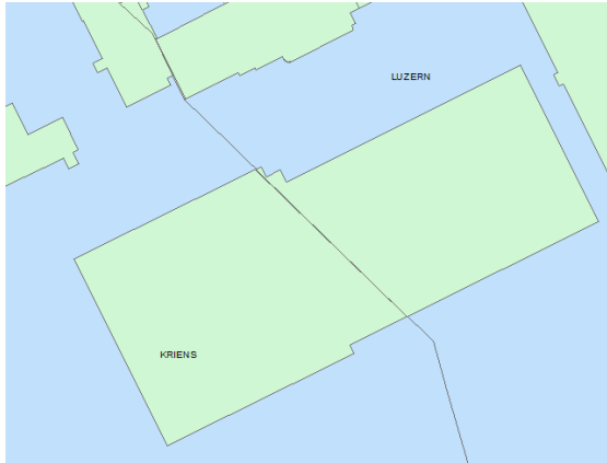
Bsp für aufgeteiltes Gebäude an Gemeindegrenze Luzern/Kriens

Kleinstlücken zwischen zwei Gebäudeteilen, die an Grenzen verlaufen wurden gefüllt.