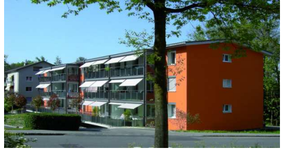
Abbildung 4 Preisgünstiger Wohnungsbau (Genossenschaft)

Eigene kommunale Anreize setzen einen finanziellen Spielraum voraus, über den viele Gemeinden nicht verfügen. Auch die Vermittlung und Aufklärung über Unterstützungsmöglichkeiten durch Bund und Kanton stellt daher eine mögliche Hilfestellung für die Eigentümer dar.