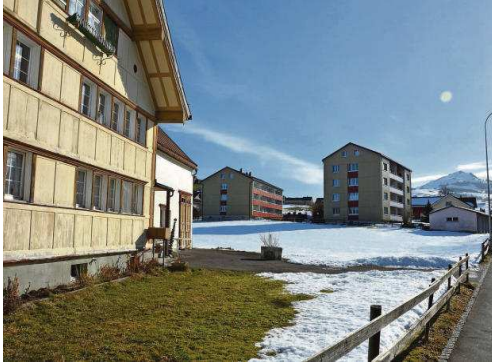
Abbildung 1 Baulandentwicklung möglich?

Viele Gemeinden im Kanton Luzern verfügen über substanzielle Bauzonenreserven – die Siedlungsentwicklung scheint langfristig gesichert. Jedoch nur auf den ersten Blick, denn ein Teil dieser Reserven steht für eine Überbauung oftmals nicht zur Verfügung. Kurzfristig können so Engpässe bei der Baulandentwicklung entstehen. Die Engpässe werden zum Teil dadurch verstärkt, dass in der Bauzone liegende Grundstücke von den Eigentümern 1 gehortet werden. Sind die betreffenden Parzellen für die Siedlungsentwicklung besonders wichtig, wird diese dadurch blockiert. Insgesamt kann dies zur Situation führen, dass eine Gemeinde trotz erheblicher Baulandreserven effektiv über zu wenig überbaubares Bauland verfügt und gleichzeitig keine neuen Einzonungen vornehmen darf. Die sogenannte Baulandverfügbarkeit, nämlich bereits eingezontes, aber nicht oder nur schlecht genutztes Land für Wohn- und gew-