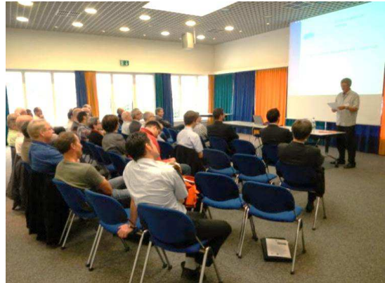
Abbildung 7 Informationsveranstaltung

Die Grundeigentümer haben ihre jeweiligen spezifischen Gründe für die Hortung bzw. Nichtbebauung von Bauland. Die damit verbundenen Herausforderungen für die Gemeinde sind ihnen möglicherweise wenig bewusst. Entsprechend ist die Verfügbarkeitsverbesserung von Bauland in Informationsveranstaltungen und durch eine systematische und gezielte Einzelansprache der Grundeigentümer zu thematisieren.