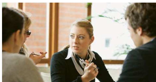
Abbildung 9 Verhandeln am Runden Tisch

dern bedingt das Zusammenwirken unterschiedlicher Akteure. Insbesondere dann, wenn die Entwicklung mehrerer Parzellen angestrebt wird, treffen mehrere Eigentümer und die öffentliche Hand mit unterschiedlichen Interessen und Handlungsspielräumen aufeinander. Die Verständigung auf eine gemeinsame Entwicklungsstrategie stellt eine grosse Hürde auf dem Weg zur Entwicklung dar.