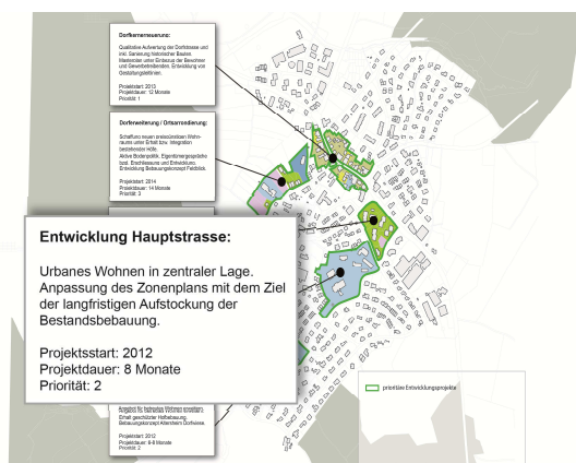
Abbildung 3 Umsetzungsplan gemäss kantonalen Arbeitshilfe „Siedlungsentwicklung nach innen“

Die kantonale Arbeitshilfe „Siedlungsentwicklung nach innen“ greift das Mittel zur Ausweisung entsprechender Flächen auf und beschreibt, wie die Identifizierung dieser Flächen vorgenommen werden kann.