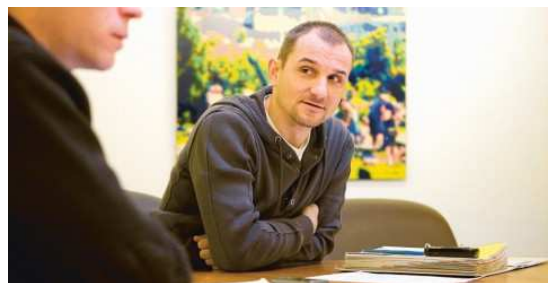
Abbildung 8 Eigentümergespräche

Einzelgespräche mit Grundeigentümern haben zum Ziel, die konkreten kurz- und langfristigen Nutzungs- und Entwicklungsabsichten gegenseitig zu erkennen. Die Gespräche bieten die Möglichkeit, die Vorteile und Potenziale der Baulandentwicklung im Sinne der kommunalen Zielsetzungen zu vermitteln sowie auf allfällige Unterstützungsangebote bei der Entwicklung hinzuweisen.