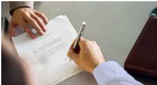
Abbildung 5 Nutzungsverträge

Nutzungsverträge stellen ein bekanntes und wirksames Instrument dar, um die Entwicklung von Bauzonen entsprechend ihrer Zweckbestimmung zu ermöglichen 5 . In der Regel kommen Nutzungsverträge im Zuge von Einzonungen im Sinne einer Einzonungsvoraussetzung zur Anwendung. Die Gemeinden können jedoch auch mit den Grundeigentümern, deren Land bereits eingezont ist, Nutzungsverträge abschliessen.